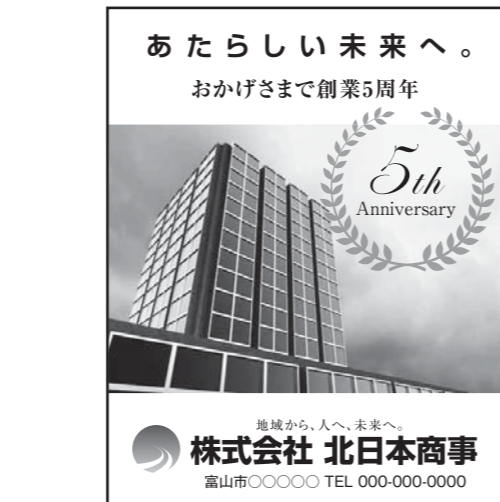
◎紙面体裁見本 突き出しD (天地66mm×左右53mm)

カラー 180,000円 単色 150,000円 モノクロ 100,000円 (※料金は消費税・制作費別途)