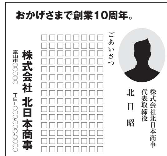
◎紙面体裁見本 突き出しA (天地66mm×左右70mm)

カラー 230,000円 単色 200,000円 モノクロ 150,000円 (※料金は消費税・制作費別途)