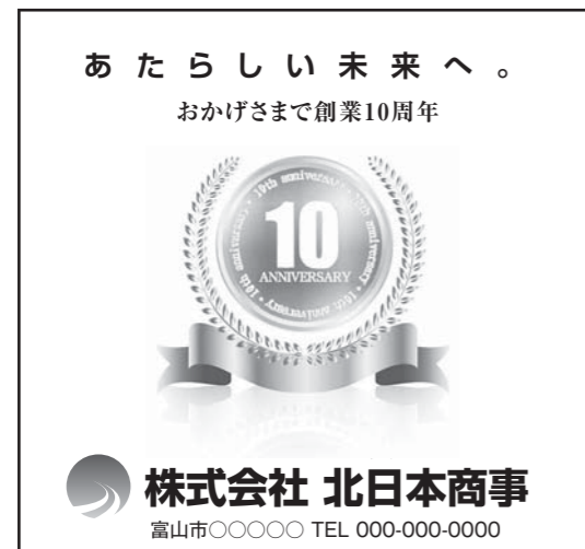
◎紙面体裁見本 突き出しC (天地66mm×左右70mm)

カラー 230,000円 単色 200,000円 モノクロ 150,000円 (※料金は消費税・制作費別途)